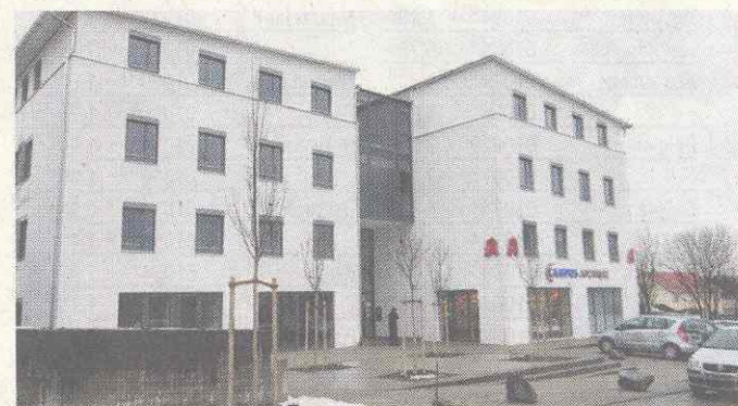
Auf 4500 Quadratmetern bietet der Medizin Campus Erding die gebündelte medizinische Fachkompetenz. Derzeit entsteht noch der Übergang zum Kreiskrankenhaus.

Internet: www.Funktionsdiagnostikzentrum-Erding.de